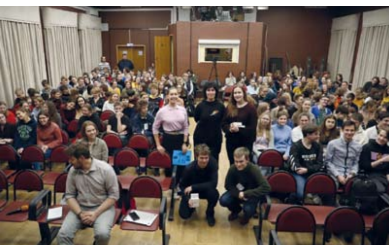
«Пирятинская лекция – 2019»: литературный критик Галина Юзефович

Участвуйте в Пирятинской премии! Читайте журнал «Историк»! Учитесь в 1505!