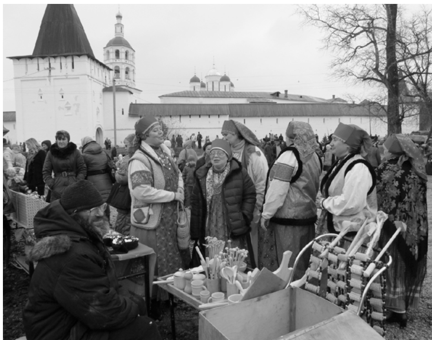
Ярмарка у стен Боровского монастыря

Это все взаимосвязано. Для человека естественно иметь большую физическую нагрузку, поэтому он занимается спортом. Природа создала человека как члена общества, для этого ему необходим язык. А уж как она создавала — это история. У любого образованного человека непреходящий интерес к тому, как все было раньше, как оно работало тогда, как появлялось в обиходе человека. Тот, кто знает историю, тот знает свои корни. Помня о корнях, ты себя как личность уже не потеряешь.