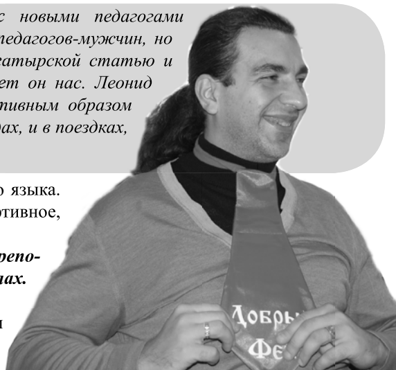
Надпись на галстуке: «Добрый фей»

Почему меняли место работы? Чего-то не хватало?