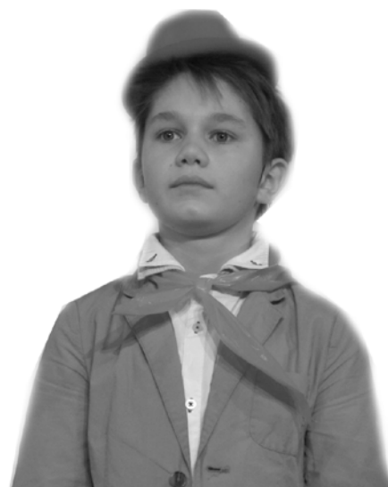
Династрия Ройтерштейнов в гимназии продолжается!