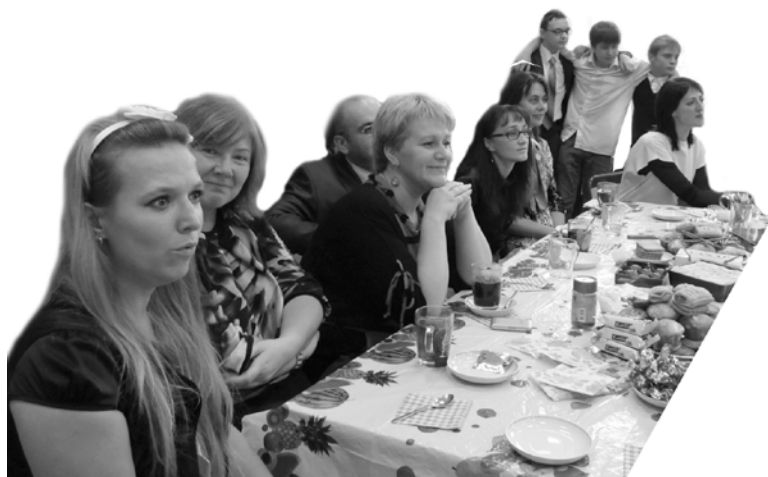
Самые благодарные зрители