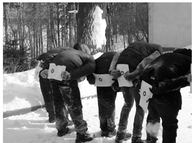
... или перехитрить противника!