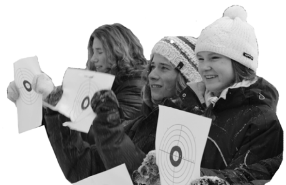
... или безропотно ждать своей участи...

P.S.: Огромное спасибо шеф-родителям за их терпение и участие.