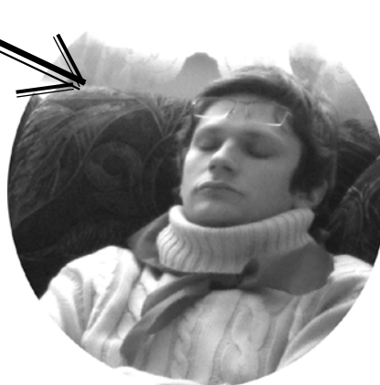
Нет, как настоящий математик, он считает монеты про себя, просто закрыв глаза!