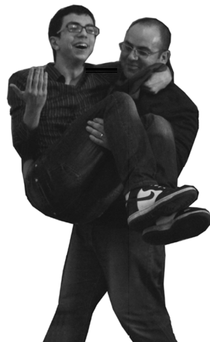
Кто кого носит на руках...