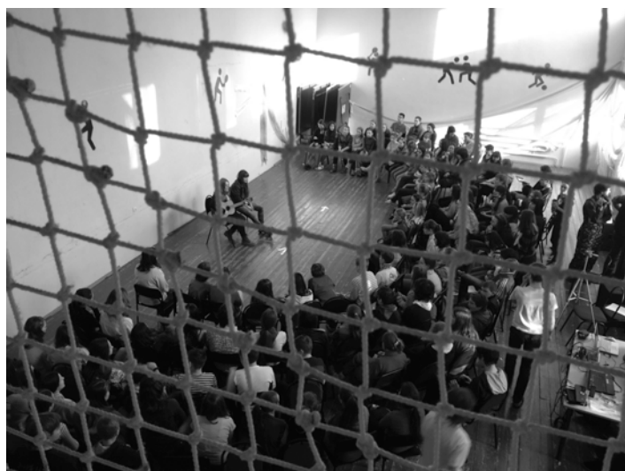
Сквозь сетку времени...