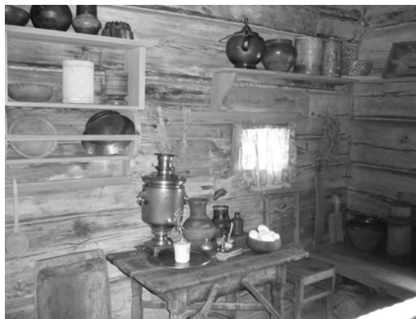
Так выглядит русская изба изнутри в Музее деревянного зодчества

Экскурсии были очень интересными. Мы посещали соборы, видели Золотые ворота, были в музее хрусталя и шли (даже бежали) полтора километра до одиноко стоящей в поле церкви Покрова на Нерли, а потом обратно... В общем, первый день был насыщенным.