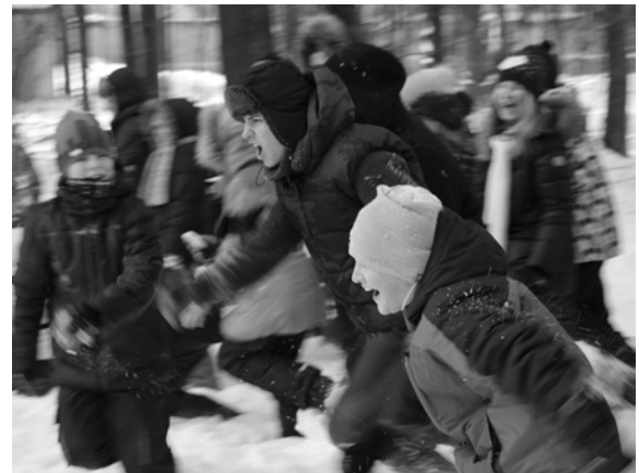
... защищающимся остается или ответить на нападение...