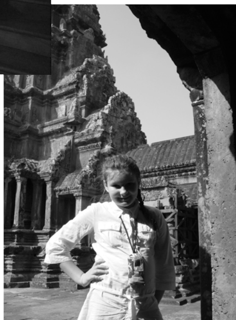
Автор на фоне того же храма Та-Пром