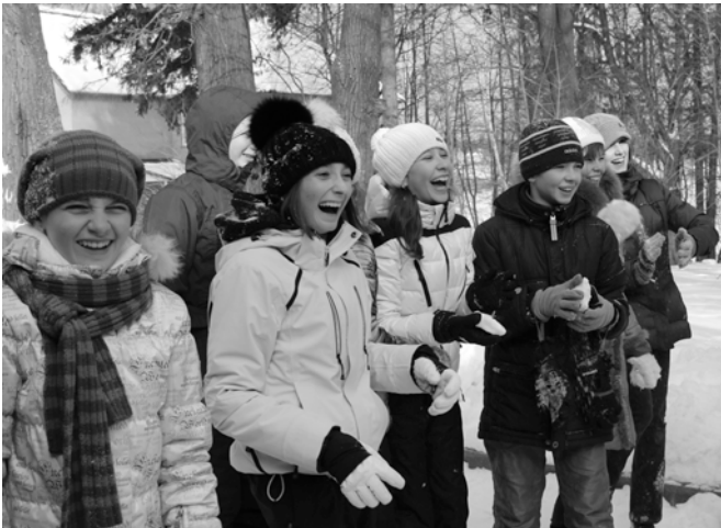
Когда нападающие в схватке так победоносно и счастливо смеются...