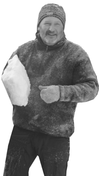
Штурм крепости в самом разгаре!