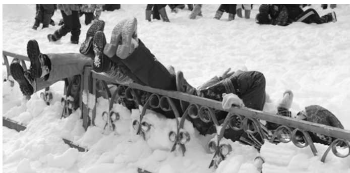
Наши ножки устали...