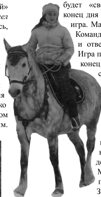
Елизавета Остащенко великолепна на лошади!

Под вечер все устали, выдохлись. Нас привезли в гостиницу в Суздаль. После размещения и ужина было свободное время, и большинство осталось в номерах. А меньшинство, в основном состоящее из мальчишек 6-а, отправилось на прогулку.