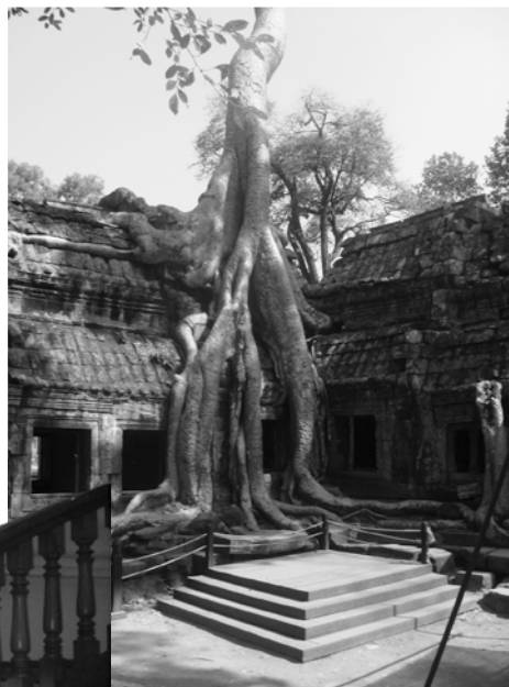
Корень баньяна в храме Та-Пром

Мне очень понравилось праздновать свой день рождения в этой экзотической стране!