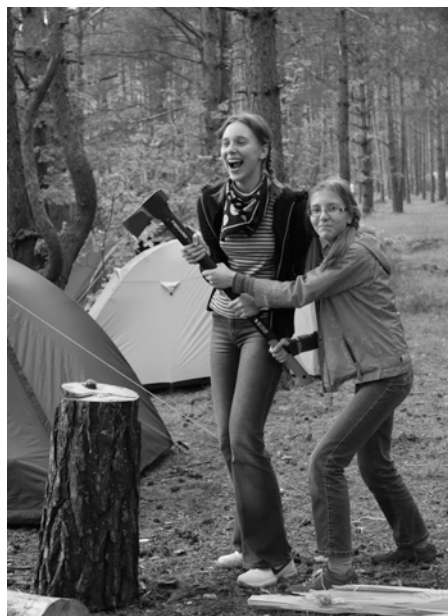
Кажется, к этим барышням лучше не приближаться...