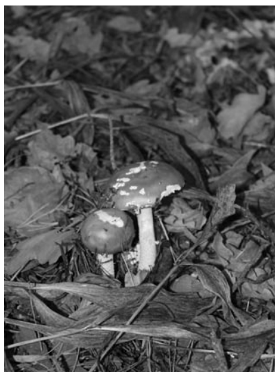
Грибы были повсюду! В каком-то из лагерей даже сварили суп!

кой большой и завораживающий. Не понравилось ориентирование. Пугали гадюки.