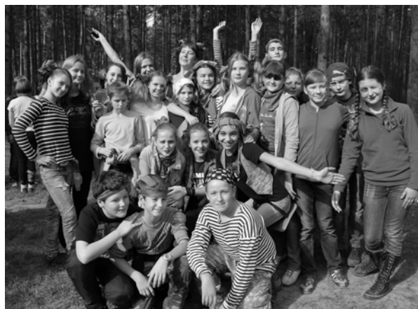
Вся «Карабанда» в сборе