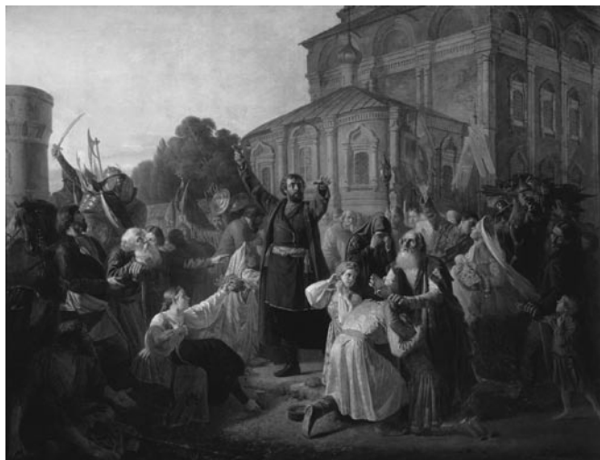
Воззвание Минина к нижегородцам в 1611 году

Хорошая организация, особенно сбор и распределение средств, создание собственной системы «приказов» (тогдашние органы управления – аналог министерств), установление связей со многими городами и районами и привлечение их к «земским делам» – все это привело к тому, что в ополчении К. Минина и Д.М. Пожарского с самого начала утвердилось единство целей и действий. «Вмес-