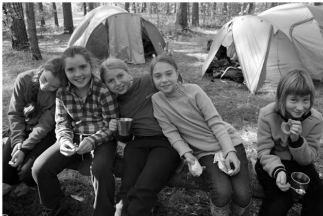
Счастливый и беззаботный 5-ый класс впервые на турслете