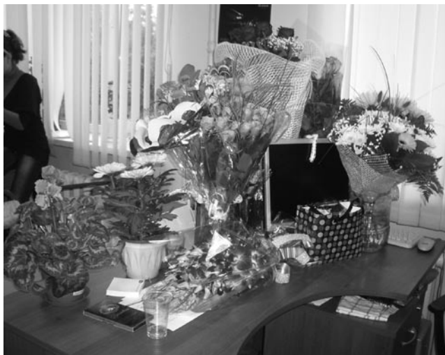
Такую картину можно было увидеть практически в каждом кабинете