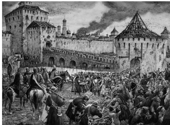
Изгнание поляков из Кремля

те заодно» – стало боевым лозунгом ополчения. В конце февраля – начале марта 1612 года ополчение выступило из Нижнего Новгорода на Москву через Балахну, Юрьевец, Кострому, Ярославль. 27 июля 1612 года основные силы ополчения выступили из Ярославля к Москве. Общая численность ополчения, по разным подсчетам, достигла 10 тысяч служилых людей (дворян и стрельцов) и 2,5 тысячи казаков. 22 августа 1612 года произошло первое сражение ополчения Д.М. Пожарского с польско-литовскими войсками гетмана Яна-Кароля Ходкевича, подошедшими на выручку осажденного в Москве гарнизона. Поражение от русского ополчения стало единственной неудачей в блестящей военной карьере гетмана Ходкевича. Отбросив от столицы польские войска, ополчение продолжало осаду польско-литовского гарнизона, сидевшего в осаде в Московском Кремле. Осада продолжалась два месяца, и, наконец, 26 октября были согласованы условия капитуляции польского гарнизона. В современном календаре по новому стилю это 4 ноября – День народного Единства.