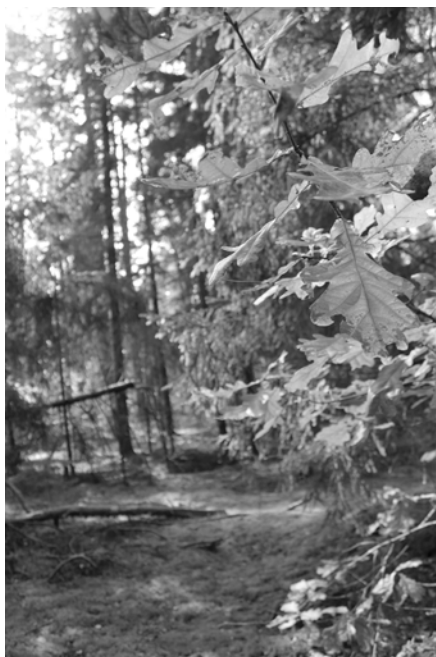
На лицезрение красот местного леса, к сожалению, было очень мало времени