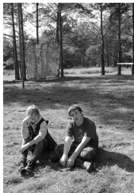
... другие бесечно отдыхают на травке...