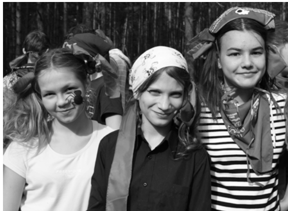
Кто сказал, что девушкам не место на пиратском корабле?