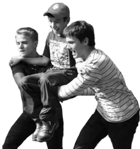
Пока одни шефы трудятся на эстафете...