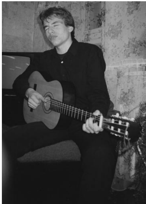
... в 1999 году