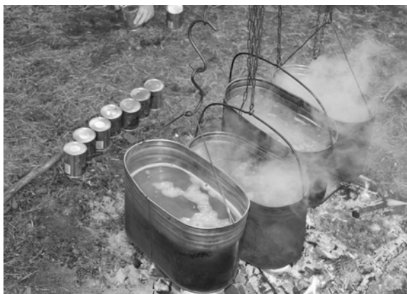
Накормить 60 человек – это вам не шутки...