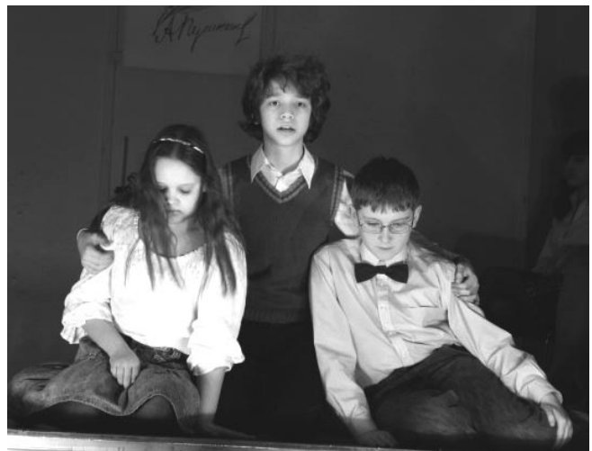
«И сердце вновь горит и любит – оттого, Что не любить оно не может»