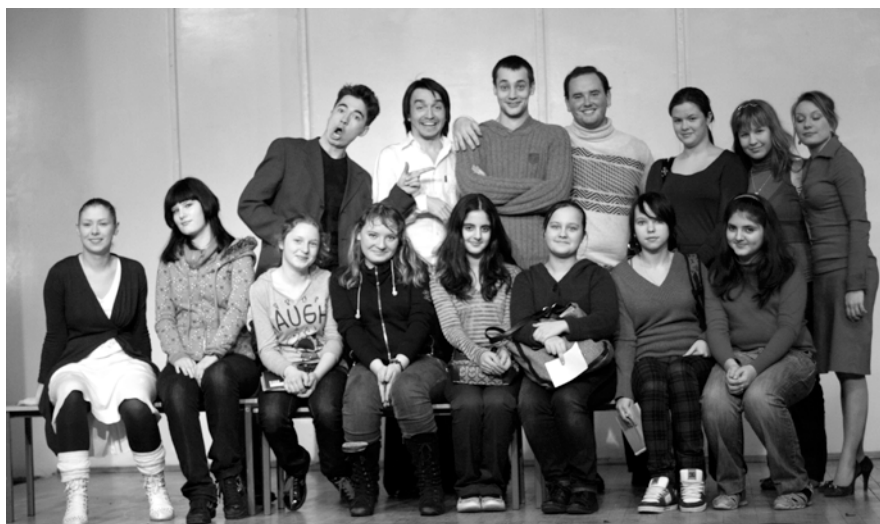
Артисты с удовольствием общались с гимназистами, фотографировались и писали пожелания