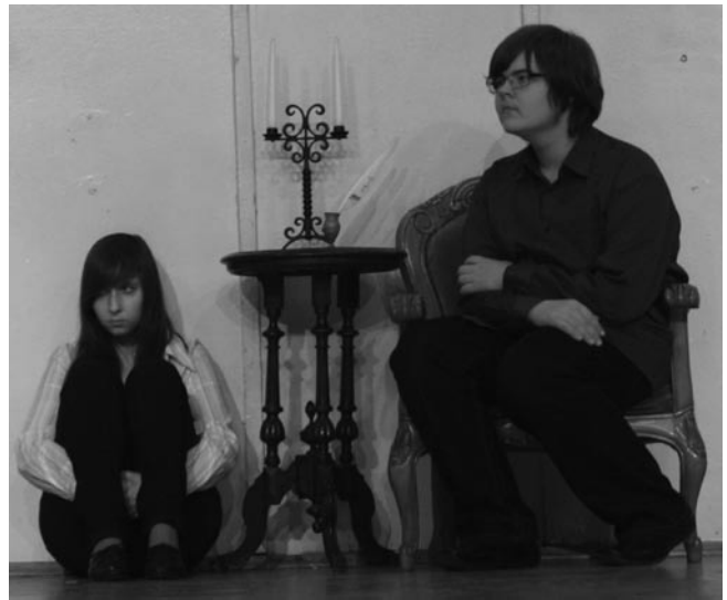
«И плачу над бренностью мира Я, маленький, глупый, больной...»