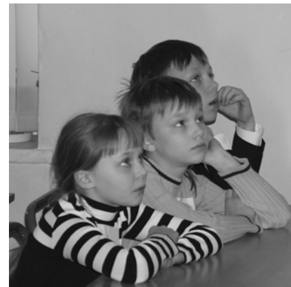
Абитуриенты гимназии: «Так вот каков гранит науки!»

Конечно, нельзя сказать, что день открытых дверей был очень увлекательным и было много не забываемых впечатлений, но это намного лучше, чем сидеть дома и пялиться в телевизор, дорогие одноклассники!