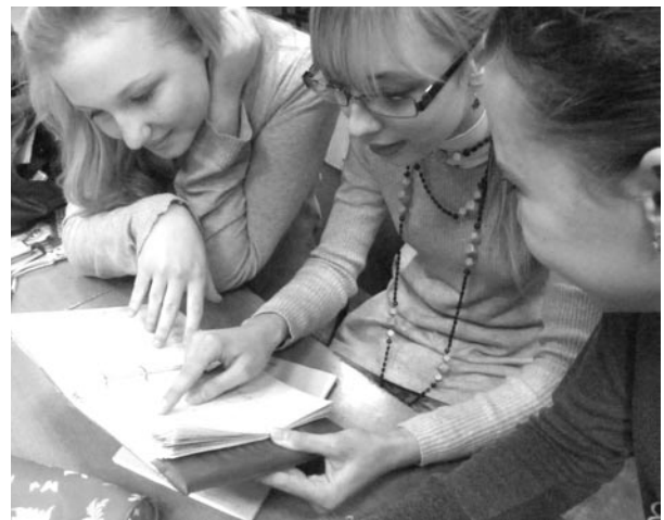
Похоже одиннадцатиклассники только и будут учиться в феврале.

17 февраля в 12-40 (на 4-ой перемене) в актовом зале гимназии состоится знакомство семей — «детям» представят их «пап» и «мам». Учителей просим запастись терпе-