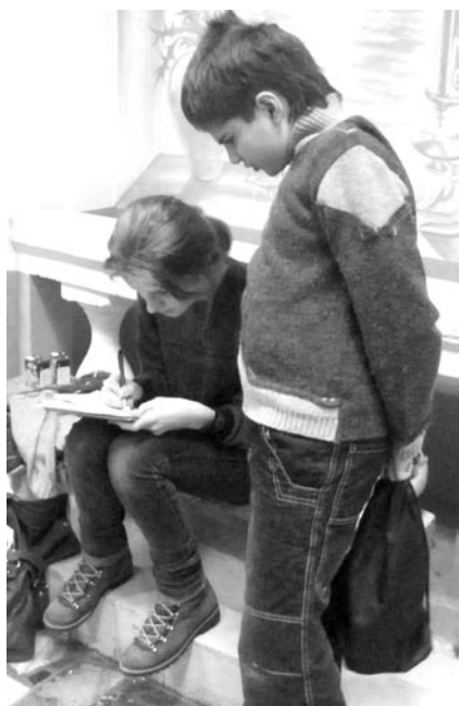
«Домашка» — это ли не повод для общения?

В этом году после небольшого перерыва возрождаются январские общегимназические дни здоровья. 30-31 января все гимназисты могут принять участие в одной из поездок по местам боев в Подмосковье. В этот выезд берут всех! Однако без нововведений не обошлось. В состав каждой из групп входят учителя истории, поэтому развивающая и обучающая часть станет чуть больше, чем обычно. Те, кто не захотел путешествовать, будут оздоравливаться дома. А 8 февраля всем группам предстоит поделиться с другими добытыми в поездке знаниями о Московской битве на конференции