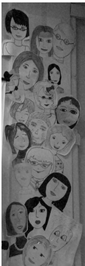
Наши лица – такие разные!