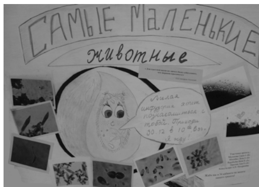
Проект «Самые маленькие животные»

судить ребят, которых ты знаешь. К каждому у тебя складывается свое отношение, с каждым ты об-