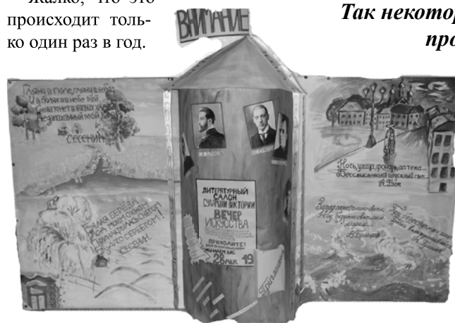
Проект «Пейзаж в творчестве поэтов Серебряного века»

судить ребят, которых ты знаешь. К каждому у тебя складывается свое отношение, с каждым ты об-