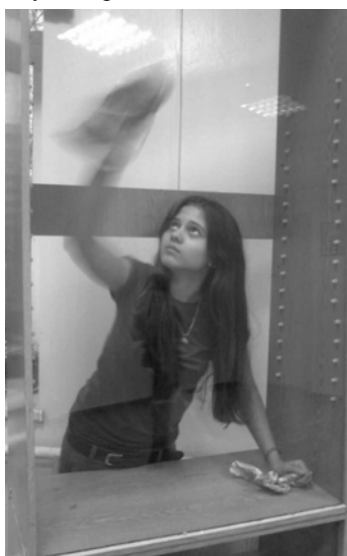
Так некоторые готовились к проектам...

В этом году, как и все 9-ые классы, я не занималась проектной деятельностью. У нас была работа посерьезней – написание реферата. Однако, связи с проектантами и продуктами их исследовательской деятельности мы не потеряли. В 9-ом классе ученикам предоставляется возможность контролировать процесс создания продукта проекта. Вот и мы не