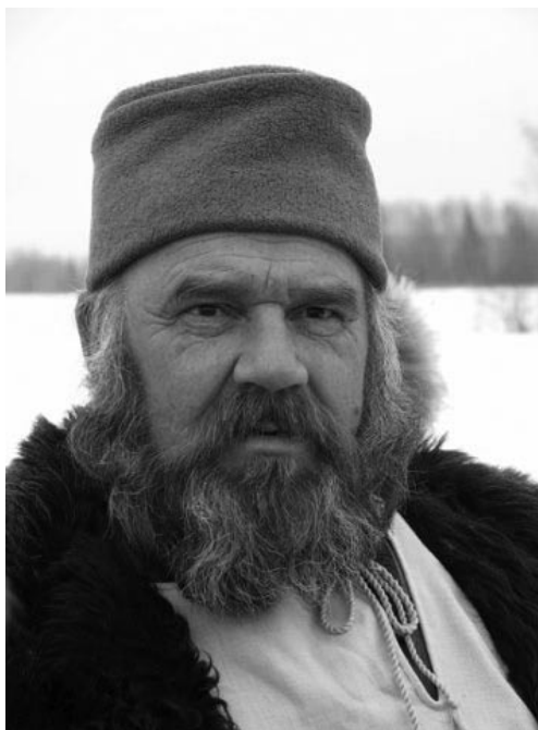
Иван Сусанин – лучший егерь Костромской области