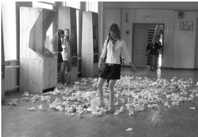
1 апреля в гимназии выпал бумажный снег