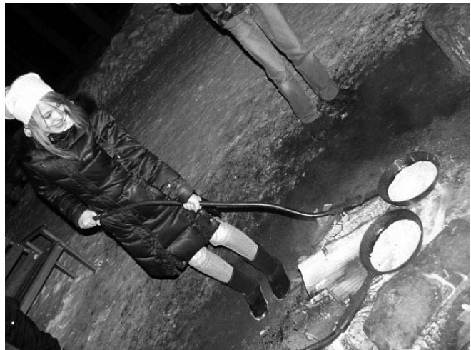
Кто из вас когда-нибудь пек блины на костре?