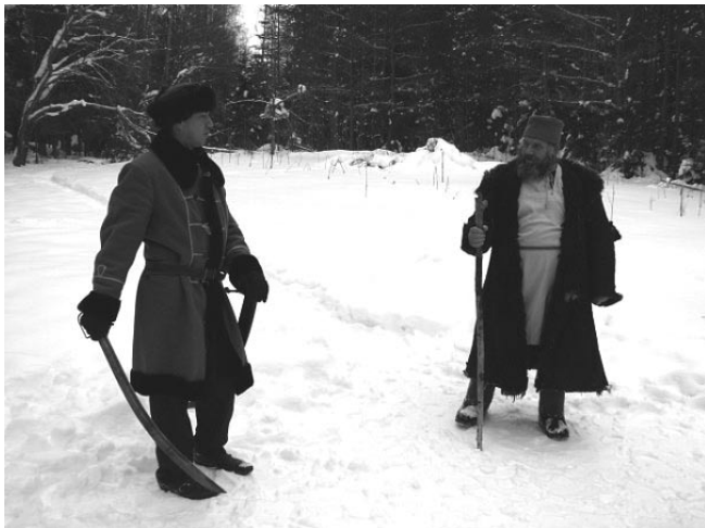
Самый настоящий Сусанин!