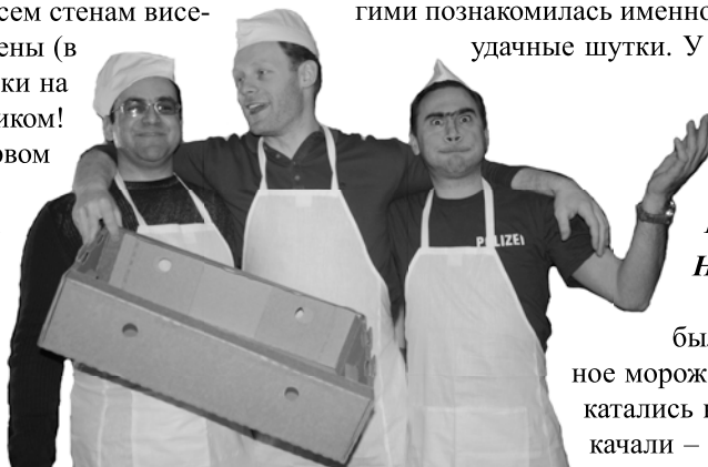
Вот такие у нас мороженщики!

Начался день с того, что родители разыграли меня, сказав, что у меня не будет дополнительного английского. Я обрадовалась! Очень понравилось бесплатное мороженое. Было классно! Лично я особых гадостей не делала, ведь я хорошая. А вот моего бедного одноклассника приклеили к стулу уже во второй раз! Это было ужасно!