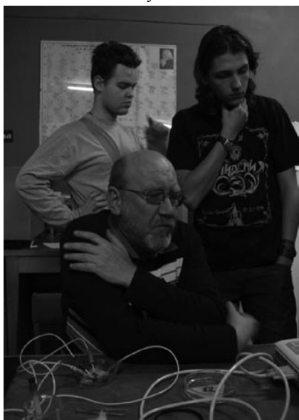
Преподаватель кафедры физиологии в лаборатории, где ребята резали лягушек

Ребята, надо ехать, особенно если вам хочется поступать в связанные