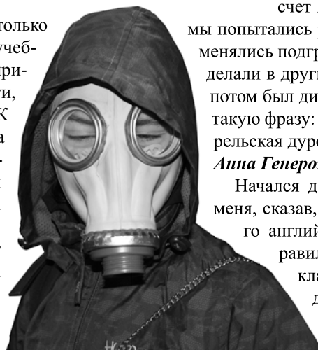
Противогаз – лучший друг!