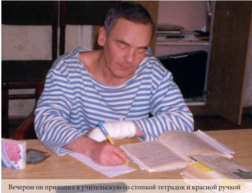
Вечером он приходил в учительскую со стопкой тетрадок и красной ручкой

для выражения своего негодования от невежества или небрежности. Он, конечно, перебарщивал, он конечно, увлекался. Это была его большая игра большого ребенка. Он играл в строгого учителя и играл очень увлеченно и талантливо. Он всегда был в курсе всего, что происходило. И если у кого-то случалось что-то плохое, он был неподалеку, помогал незаметно, но очень уместно и очень талантливо. Знал он очень много, никогда не был сам доволен и стремился узнать еще больше, не афишируя этого.