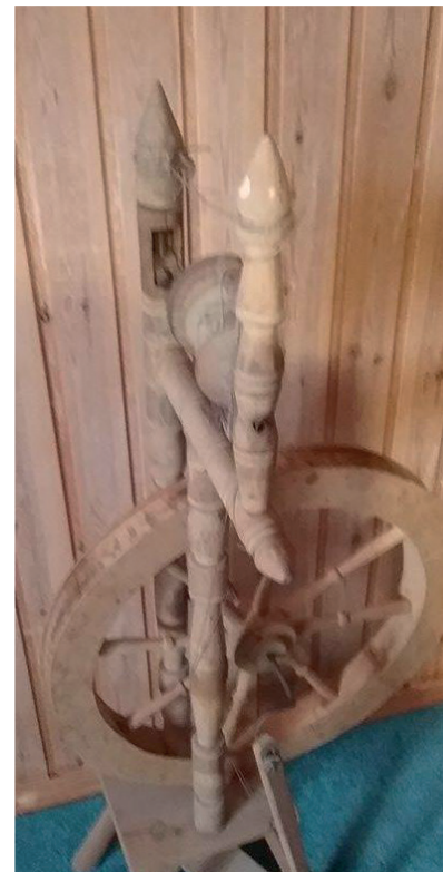
Иногда, проходя мимо подаренной им прялки, дотрагиваюсь до теплого дерева, как будто до теплой руки щедрого человека